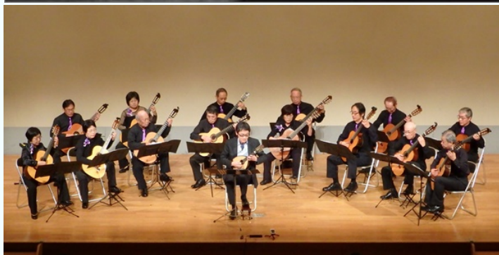
高槻ギタークラブ10周年記念コンサート(2016年)より